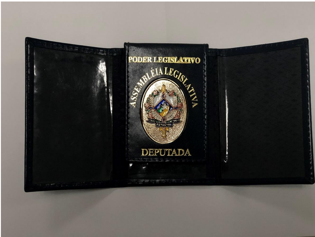
Parte interna da carteira com a lapela móvel abaixada