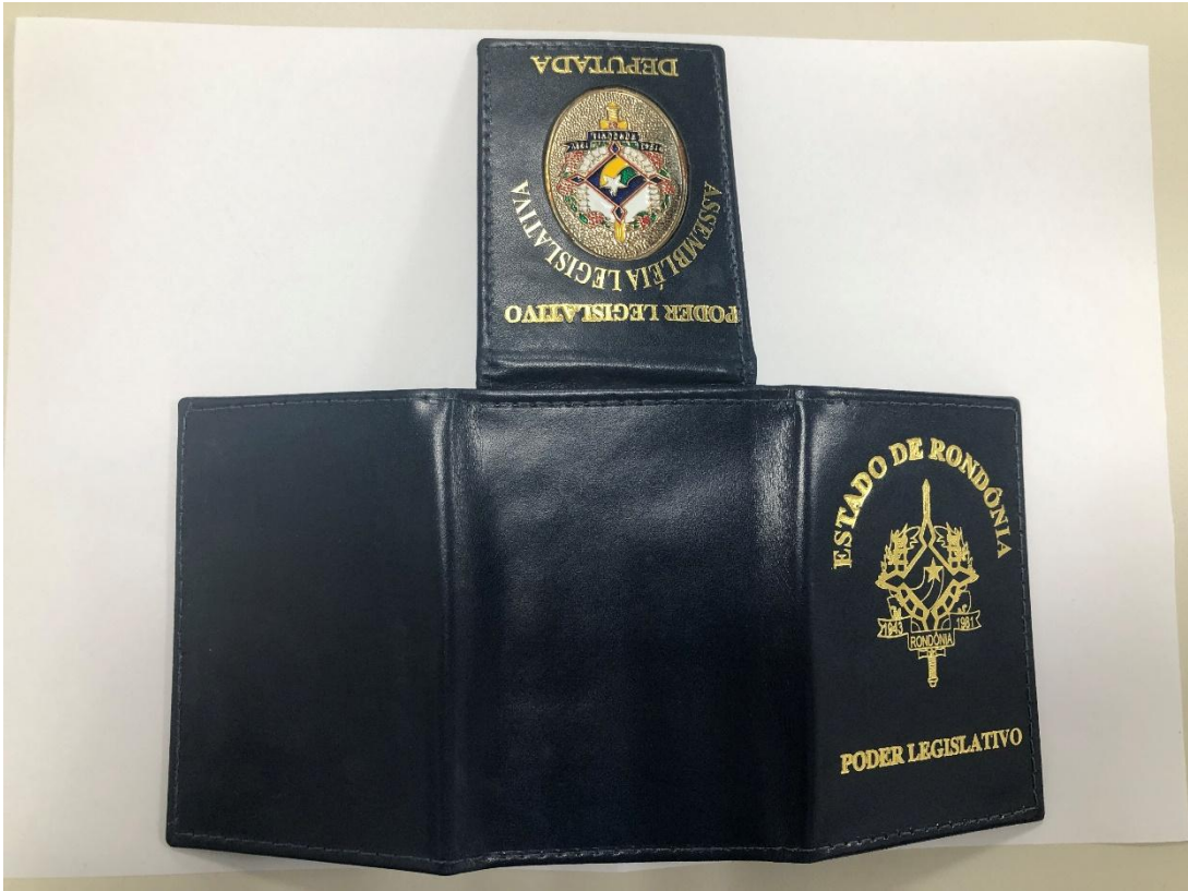
Frente da carteira aberta